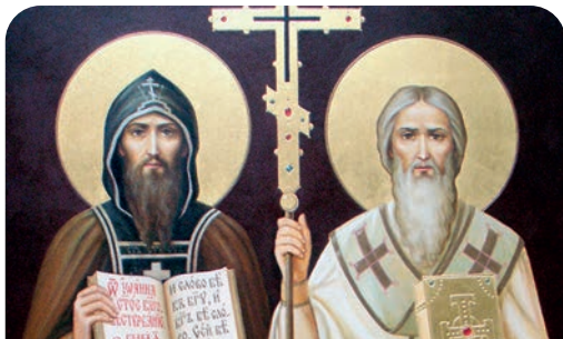
Άγιοι Ισαπόστολοι Κύριλλος και Μεθόδιος