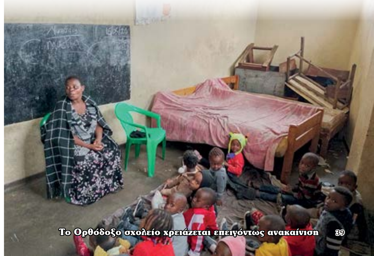
Το Ορθόδοξο σχολείο χρειάζεται επειγόντως ανακαίνισι

Επίσης, η πλήρης ηλεκτροδότησι και μηχανοργάνωσί του, είναι άκρως απαραίτητη διά την εύρυθμον και αποδοτικήν λειτουργίαν του. Μας έχουν παρακαλέσει επανειλημμένως προς τούτο, η διεύθυνσι και οι διδάσκοντες.