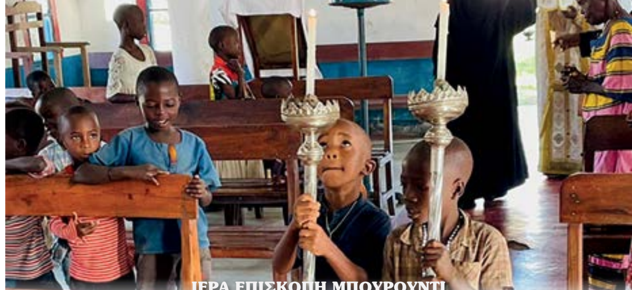
ΙΕΡΑ ΕΠΙΣΚΟΠΗ ΜΠΟΥΡΟΥΝΤΙ