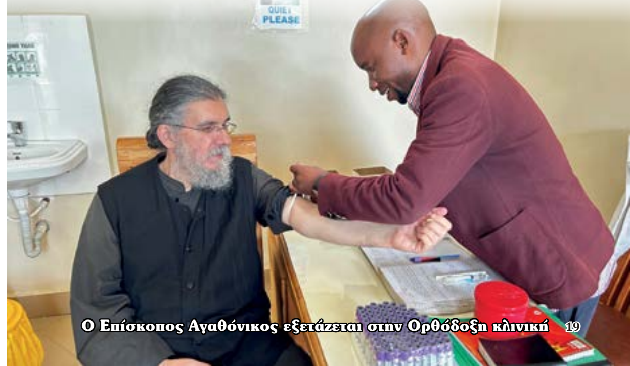
Ο Επίσκοπος Αγαθόνικος εξετάζεται στην Ορθόδοξη κλινική 19

Σὲ ὅλα τὰ χρόνια τῆς ἱεραποστολικῆς διακονίας στὴν Ἄφρική διαπιστώνουμε ὅτι ὁ θάνατος τῶν παιδιῶν και τῶν μητέρων κατὰ τὴ γέννα παραμένει ἀπὸ τὰ πιὸ ἐπείγοντα και τραγικά προβλήματα υγείας στὴν ἡπειρο αὐτή. Η περιοχή στὴν ὁποία δραστηριοποιούμαστε, διατηρεῖ ὑψηλά ποσοστά μητρικῆς και βρεφικῆς θνησιμότητας. Ἐγκυμοσύνες, που δὲν παρακολουθοῦ-