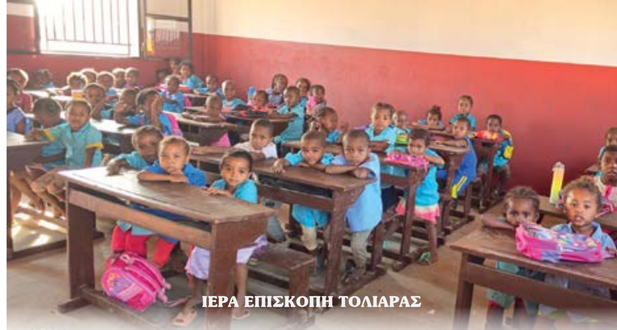
ΙΕΡΑ ΕΠΙΣΚΟΠΗ ΤΟΛΙΑΡΑΣ