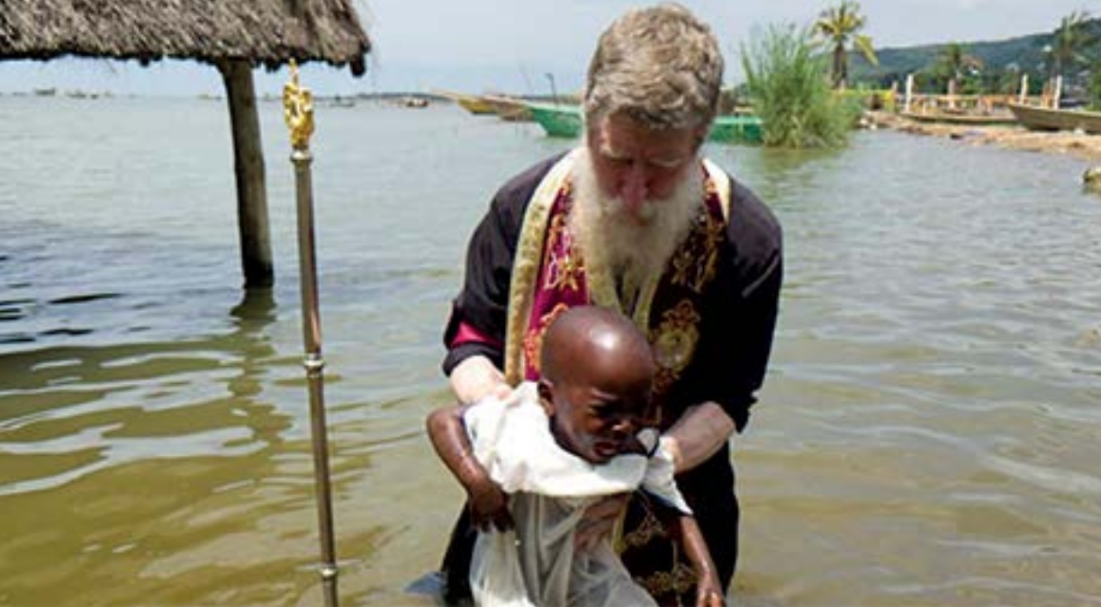
Βάπτισμα από τον επίσκοπο Μπουρούντι Ισαάκ

τον πολιτισμό της Ορθοδοξίας. Βέβαια από τότε μέχρι σήμερα άλλαξαν πολλά. Οι Έλληνες έμειναν λίγοι, αλλά είναι πραγματικά Έλληνες Ορθόδοξοι Χριστιανοί, παρόλο που είναι μακριά από την μητέρα πατρίδα και από τον τόπο όπου χτυπά η καρδιά της Ορθοδοξίας.