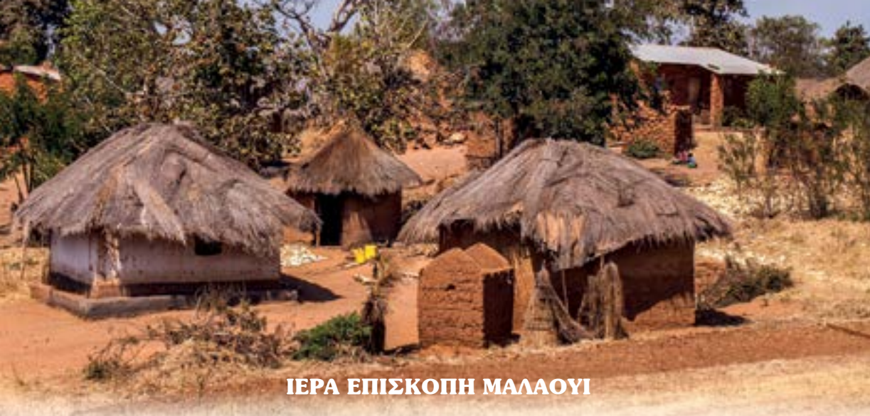
ΙΕΡΑ ΕΠΙΣΚΟΠΗ ΜΑΛΑΟΥΙ