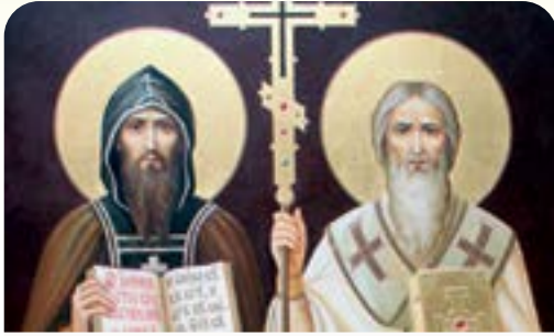
Αγιοι Ισαπόστολοι Κύριλλος και Μεθόδιος